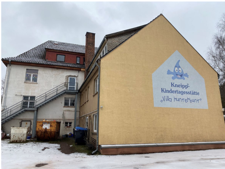
Westansicht: Bestandsgebäude mit Anbau