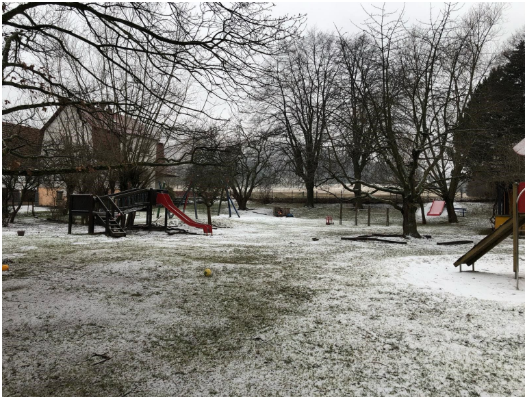
Südwest-west-Ansicht: Erhaltenswerter Garten