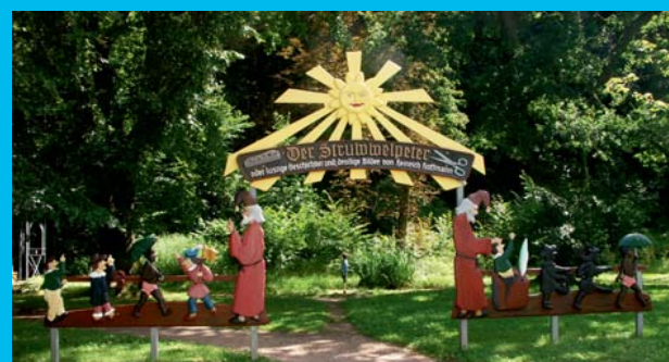
Eingang zur Märchenwiese mit den Struwwelpeter-Figuren