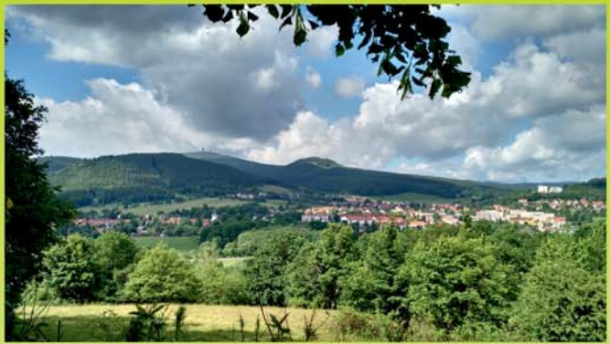
Blick von Deysingslust auf Bad Tabarz mit dem Inselfberg im Hintergrund