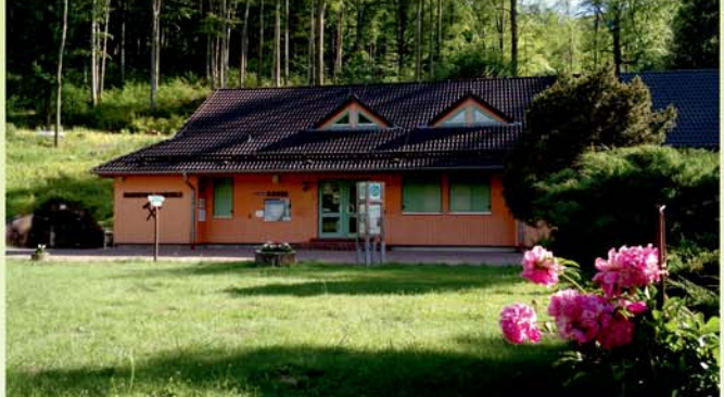
Der Eingang der Marienglashöhle direkt am Benediktinerpfad