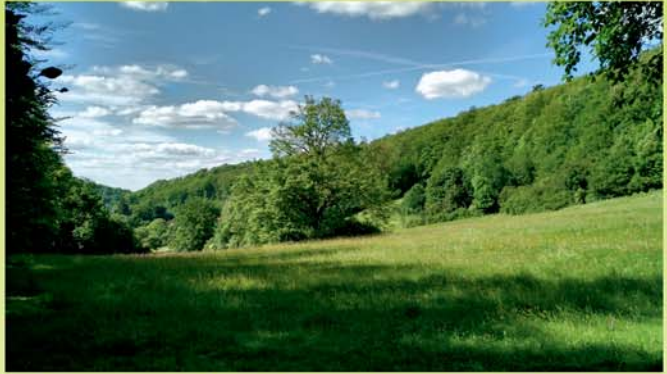
„Kräuterwiese“ unterhalb von „Schloss Tenneberg“