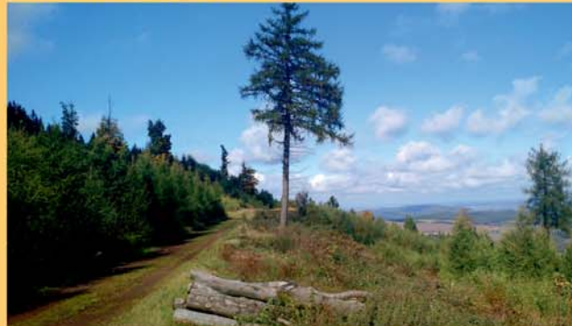
Der Weg um den Zimmerberg mit Blick Richtung Hörselberge bei Eisenach

Die Bad Tabarzer Aussichtstour beginnt als Rundweg an der Touristinfo und nähert sich dem „Rennsteig“ bis auf 1km Entfernung. Auf gut begehbaren Wanderwegen geht es immer bergan zur Schutzhütte auf dem Zimmerberg. Leicht ansteigend, mit herrlichen Ausblicken, führt der Weg weiter um den Zimmerberg und Übelberg vorbei an der „Hexenbank“. Bei einem Abstecher zum Gipfel des Übelberges hat man den höchsten Punkt der Tour (713M üNN) erreicht. Weiter zum „Gickelhahnsprung“ und über den „Fünfarmigen Wegweiser“ leicht bergab zum „Hirschstein“ und „Roten Turm“. Nach einem Abstecher zum „Aschenbergstein“ gelangt man dann durch den „Bärenbruchsgraben“ in den Lauchgrund, der zu den schönsten Tälern Thüringens gehört! Von hier geht ein breiter ebener Weg die letzten 2,3km bis zum Startpunkt der Tour an der Touristinfo. Am Ende führt der Wanderweg noch am Lutherbrunnen, der Kneipp-Kuranlage Arenarisquelle, der Märchenwiese mit den geschnitzten Struwelpetergeschichten und der „Kurklinik am Rennsteig“ vorbei.