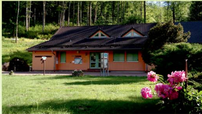
Der Eingang der Marienglashöhle direkt am Benediktinerpfad