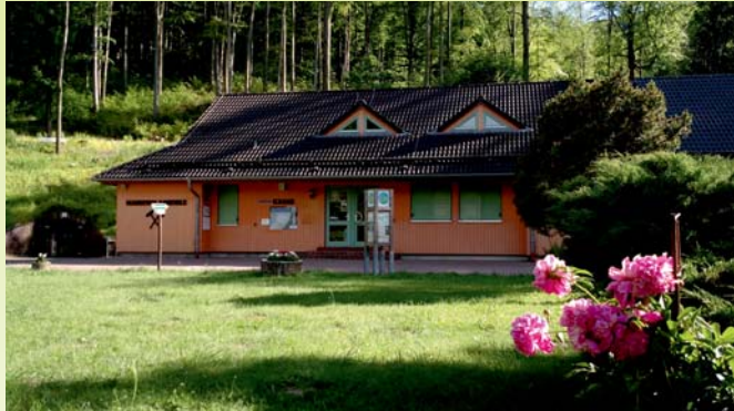
Der Eingang der Marienglashöhle direkt am Benediktinerpfad