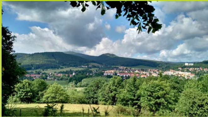
Blick von Deysingslust auf Bad Tabarz mit dem Inselfberg im Hintergrund