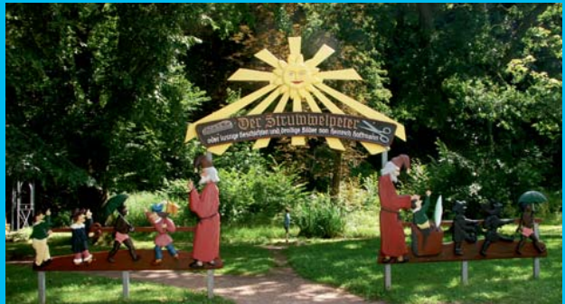
Eingang zur Märchenwiese mit den Struwwelpeter-Figuren