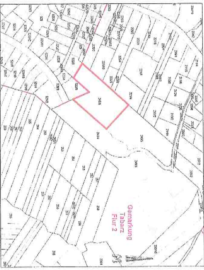
Übersichtslegisplan zum Geltungsbereich der 2. Änderung des Flächennutzungsplanes der Gemeinde Bad Tabarz

entschieden werden, sofern sich nicht aus der Art der Einwände oder der betroffenen Personen ausdrückliche oder offensichtliche Einschränkungen ergeben. Soll eine Stellungnahme nur anonym behandelt werden, ist dies auf derselben eindeutig zu vermerken.